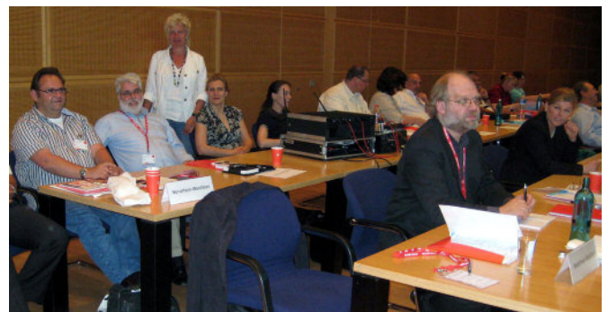
Die NRW-Delegation im Willy-Brandt-Haus